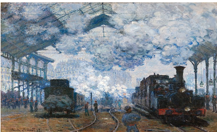
La gare Saint-Lazare, arrivée d'un train 1877 huile sur toile (80X98cm)

Les peintres impressionnistes sont attirés par les éléments innovants de la ville moderne, en particulier ceux liés au monde ferroviaire.Les gares ferroviaires sont devenues un élément central de « l'iconographie » impressionniste. Et parmi eux, la gare Saint-Lazare de Claude Monet.