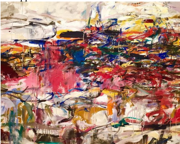
Joan Mitchell, expressionnisme abstrait, «paysage urbain» (1955, Art Institute of Chicago)

"le peintre de la solitude urbaine". Il préférait les scènes qui se déroulent à l'intérieur des hôtels et des appartements