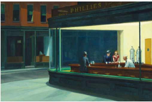
Edgar Hopper, Nighthawks, (1942) Art Institute of Chicago

"le peintre de la solitude urbaine". Il préférait les scènes qui se déroulent à l'intérieur des hôtels et des appartements